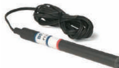
Sonda di temperatura