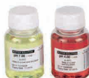
Soluzione tampone pH