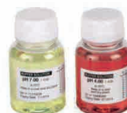
Soluzione tampone pH