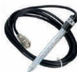
Sonda ORP oro