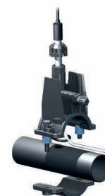
Porta sonda da 1/2"