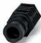
Porta sonda da 1/2"

Kit composto da una sonda temperatura e portasonda da 1/2"